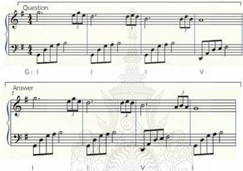
ภาพที่ 1 รูปแบบคีตลักษณ์ ห้องที่ 1-4 ประโยคคำถาม และห้องที่ 5-8 ประโยคคำตอบ

ตัวอย่างที่ 1 ห้องที่ 1 – 4 ประโยคคำถาม และห้องที่ 5 – 8 ประโยคคำตอบ