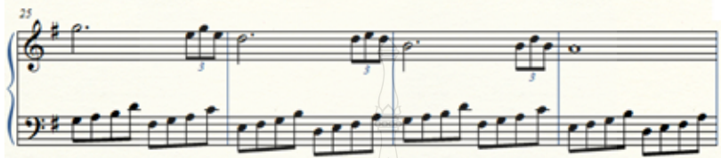
ภาพที่ 3 รูปแบบคีตลักษณ์ ห้องที่ 33 – 40

ตัวอย่างที่ 3 แนวทำนองในมือซ้ายจะมีการเปลี่ยนรูปแบบการเล่น คล้ายกับบันไดเสียงเพนทาทอนิก