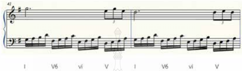
ภาพที่ 5 รูปแบบคีตลักษณ์ โน้ตเชบ็ต 2 ชั้น

ตัวอย่างที่ 5 แนวทำนองในมือซ้ายอยู่ในรูปของโน้ตเชบ็ต 2 ชั้น