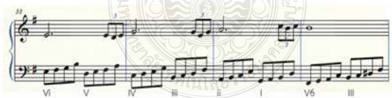
ภาพที่ 4 รูปแบบคีตลักษณ์ ห้องที่ 14 - 48

ตัวอย่างที่ 4 มีการเปลี่ยนแนวทำนองในมือซ้ายไปยังโหมดของกลุ่มเสียงไมเนอร์สัมพันธ์