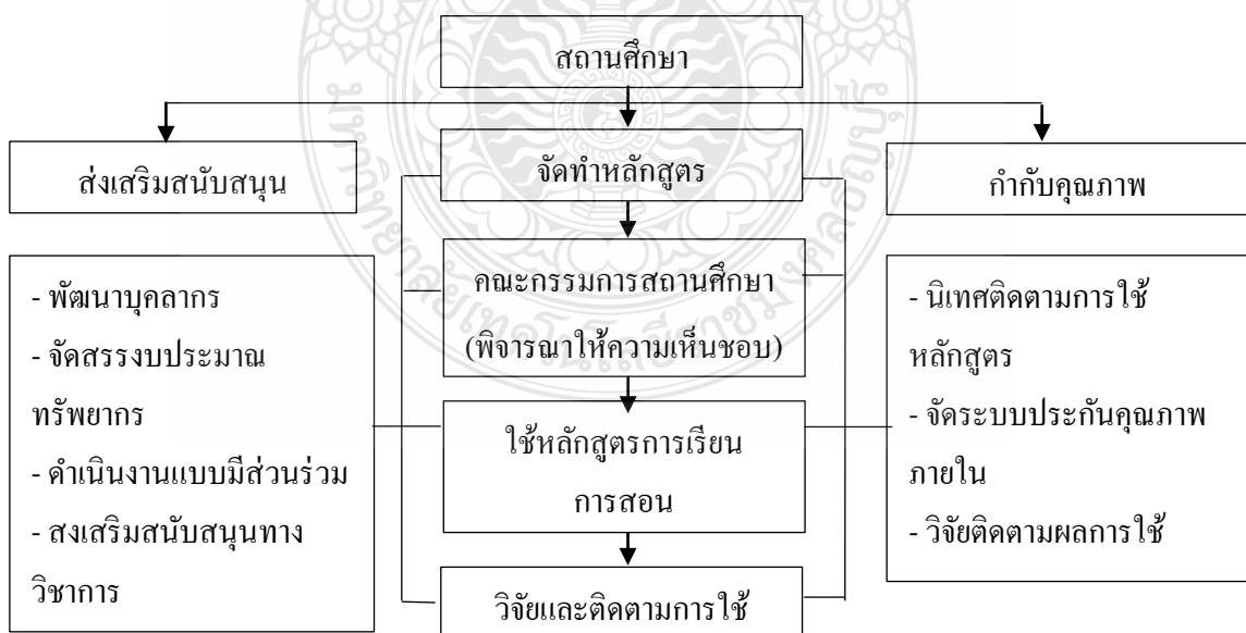
ภาพที่ 2.1 ขั้นตอนการบริหารหลักสูตร

ในการบริหารจัดการหลักสูตรสถานศึกษานั้น ได้มีนักวิชาการ นักการศึกษา ตลอดจนหน่วยงานทางการศึกษาหลายหน่วยงานได้เสนอขั้นตอนในการบริหารหลักสูตร ไว้ดังนี้